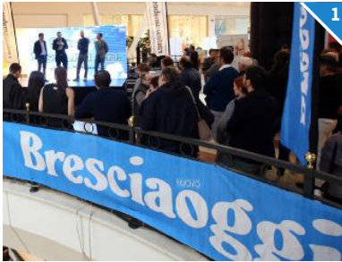
DALLA PARTE DELLE DONNE. Nasce dal giornale e conquista il sostegno di sponsor e amici l'iniziativa «Volley per la Vita», finalizzata a sensibilizzare e raccogliere fondi per la prevenzione e la cura del tumore al seno.

Una settimana di pagine speciali sul nostro giornale, per far conoscere e sensibilizzare; un anno di impegno da parte di Banca Valsabbina e della Millenium Brescia di serie A1 femminile; l'ospitalità dello shopping center Il Leone di Lonato per l'evento finale: «Volley per la Vita» è un miracolo di concreta solidarietà.