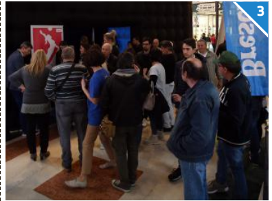
TRA SHOPPING E IMPEGNO. Il padiglione allestito nel centro commerciale di Lonato ha permesso l'incontro con tantissime persone che, come sempre, affollavano la struttura per il «rito» dello shopping domenicale.

L'EVENTO. Splendido successo e un gran finale per «Volley per la vita», l'iniziativa benefica lanciata dal quotidiano