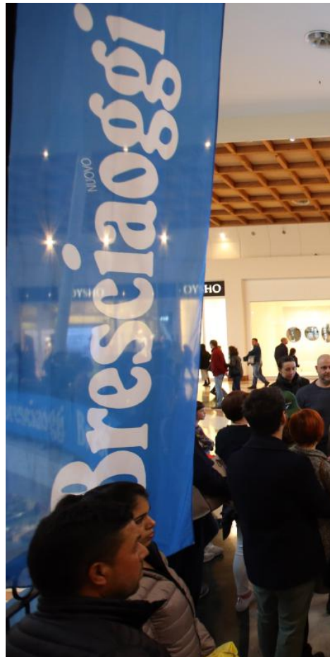
«Volley per la Vita» va in archivio con un grande successo e un importante contributo