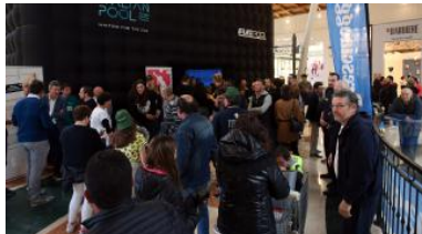
Tanto pubblico e grande interesse all'evento di «Volley per la Vita»

giovedì consegneremo a Komen tramite Banca Valsabbina, sponsor principale dell'iniziativa insieme a Il Leone».