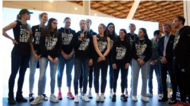
Le atlete della Banca Valsabbina Millenium Brescia di serie A1