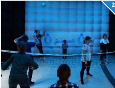
PALLAVOLO IN VETRINA. Per l'evento finale dell'iniziativa al «Leone» un grande cubo azzurro con il logo della Fipav, la Federazione italiana pallavolo, ha dato modo ai bambini di scoprire questo meraviglioso sport.