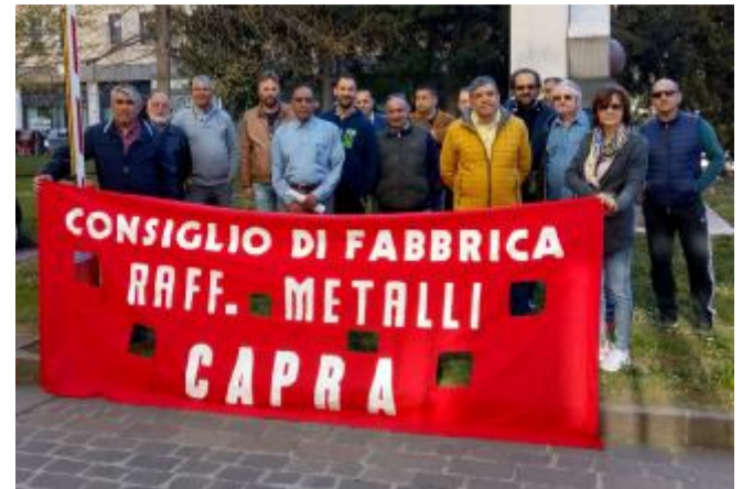
Lavoratori della Raffineria Metalli Capra in pressing sull'Inps

La nuova iniziativa - dopo l'assemblea organizzata sempre davanti all'istituto di previdenza sociale all'inizio di aprile - è stata decisa «per dare risalto al fatto che gli addetti non percepiscono il corrispettivo di Cassa integrazione straordinaria dall'inizio dell'anno». Quindi sollecitano l'Inps «a intervenire al fine di erogare quanto previsto dalla legge e già deliberato dal ministero competente», si legge nel comunicato. Inoltre, «chiedono che il Dicastero autorizzi in tempi brevi la nuova richiesta di Cigs dal giorno 30 gennaio 2019, per dare seguito poi ai pagamenti dei mesi arretrati e di quelli successivi». Proprio riguardo l'ammortizzatore sociale nei giorni scorsi è arrivato l'ok al decreto dal ministero competente.